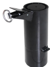
Boitier d'amovibilité blocage par vis pointeau

Aux normes handicapés Répond aux nouvelles normes suivant l'arrêté du 18 septembre 2012.