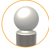
Détail de la tête PMR :

Aux normes handicapés Répond aux nouvelles normes suivant l'arrêté du 18 septembre 2012.